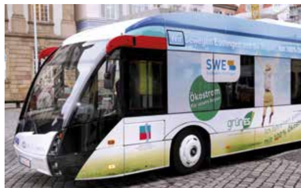
Elektro-Hybrid-Bus, Stadt Esslingen