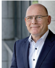
Winfried Hermann Minister für Verkehr Baden-Württemberg