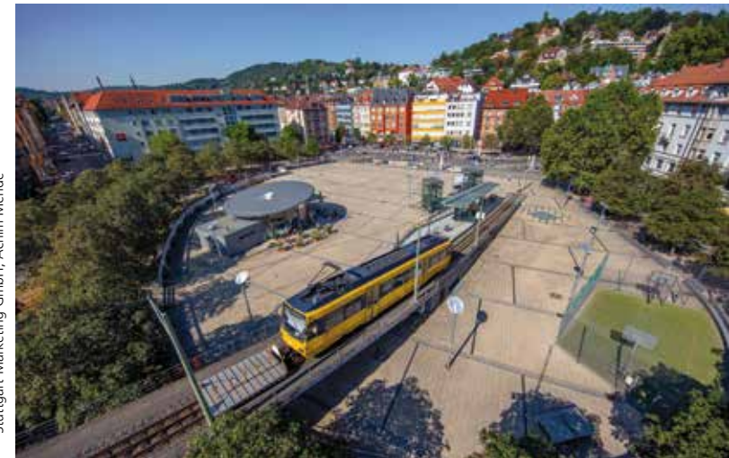
Stuttgart-Marketing GmbH, Achim Mende