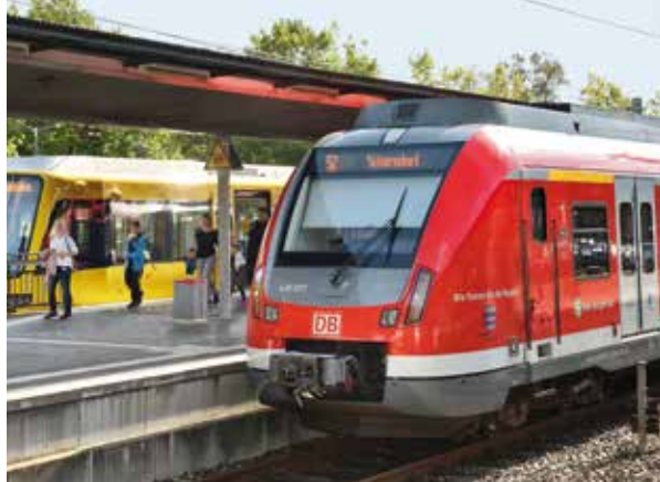
Presse-, Werbe- und Eventfotografie – Günter E. Bergmann