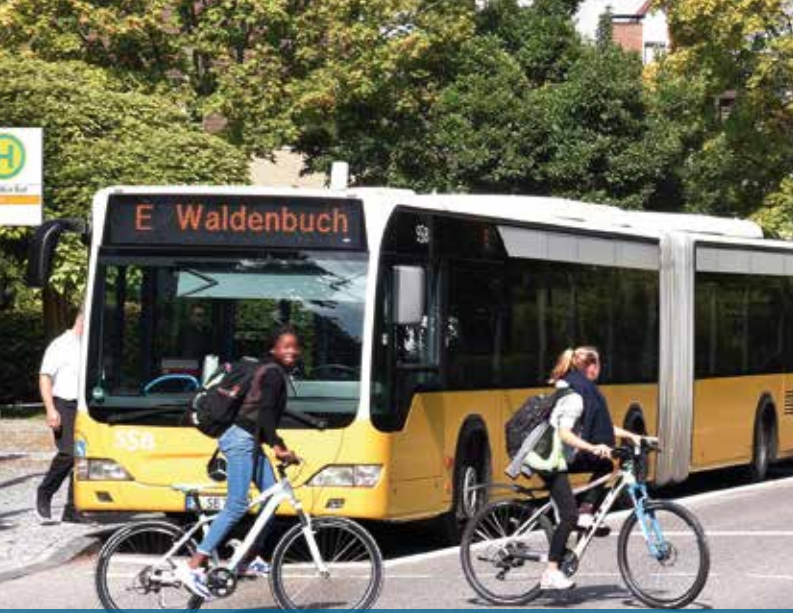
Titelfoto: Presse-, Werbe- und Eventfotografie – Günter E. Bergmann; gedruckt auf Papier mit FSC-Zertifizierungssiegel, www.fsc.org