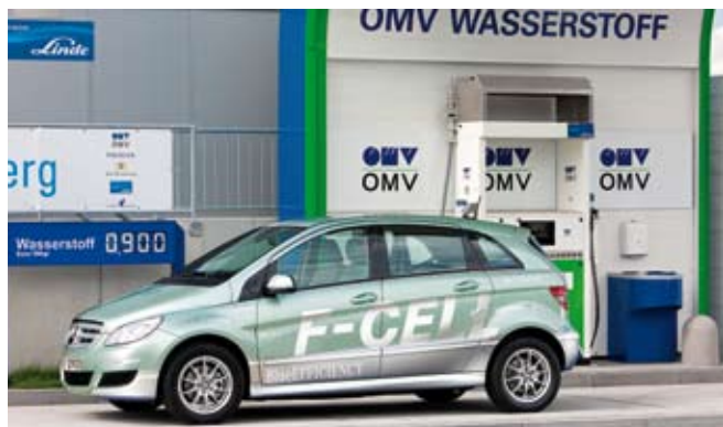
Mercedes-Benz B-Klasse F-CELL, Daimler AG