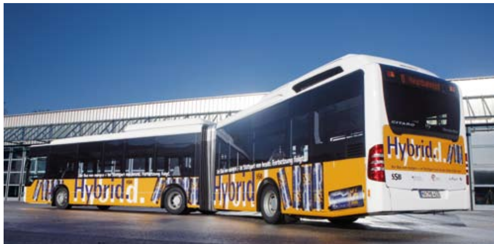
Citaro Dieselhybridbus, SSB AG

Der 18 Meter lange Mercedes-Benz Gelenkbus Citaro G BlueTec-Hybrid erlaubt das völlig abgasfreie Fahren auf Teilstrecken, den leisen und praktisch ruckfreien Antrieb – das einzigartige Fahrzeugkonzept mit vier elektrischen Radnabenmotoren sowie einer der weltweit größten Lithium-Ionen-Batterien im Fahrzeug-Einsatz. Diese Batterie speichert die Energie aus dem Dieselgenerator und die beim Bremsen zurück gewonnene elektrische Energie. Somit wird der ohnehin schon niedrige Dieselverbrauch um bis zu 30 Prozent und im gleichen Maß der CO 2 -Ausstoß reduziert.