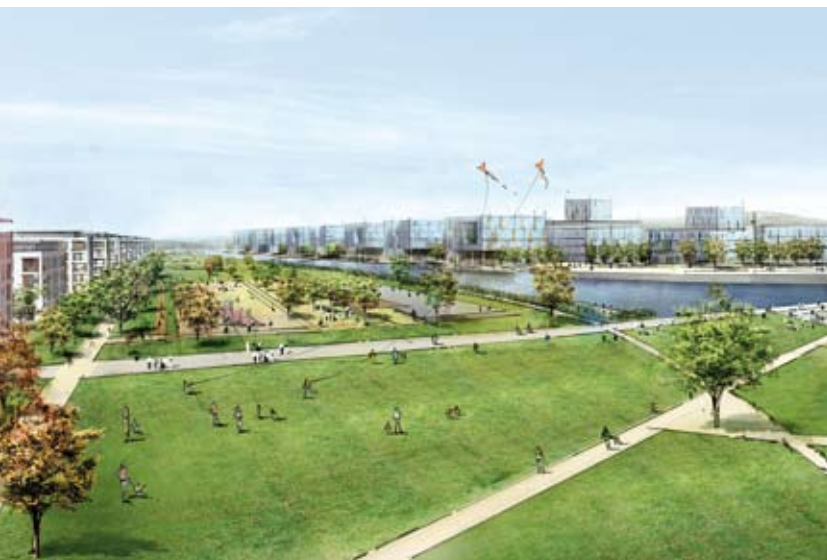
Hin zur elektromobilen Stadt, Zweckverband Flugfeld Böblingen/Sindelfingen