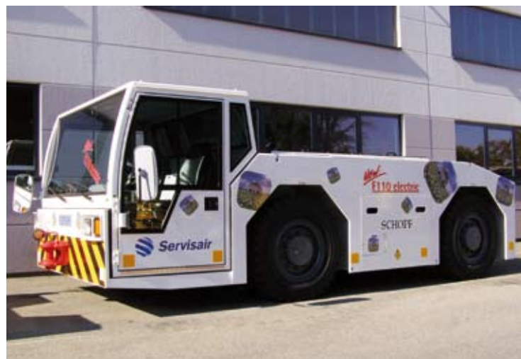
F110 „electric“, Schopf Maschinenbau GmbH