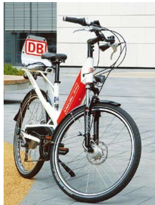
Call a Bike, Landeshauptstadt Stuttgart

Die Nutzung elektromobiler Fahrzeuge muss der Verkehrssicherheit aller Nutzer des öffentlichen Raums genügen. Hier sollen baurechtliche Leitplanken aufgestellt werden. Die spezifische Konstellation zwischen bestehenden Quartieren in den beiden Städten und dem sich neu entwickelnden Flugfeld ermöglicht einen zielgruppenorientierten Entwicklungsplan für kommunale Handlungsstrategien.