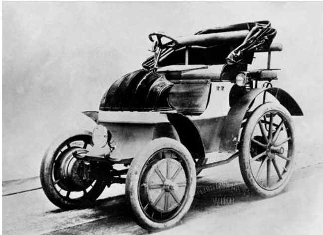
Lohner Porsche, Dr. Ing.h.c. F. Porsche AG

Höchsten Ruhm erntete diese zukunftsweisende Erfindung auch später im Zeitalter der Weltraumfahrt. Die NASA nutzte die Idee des elektrischen Radnabenmotors, um ihr Mondfahrzeug damit zum Rollen zu bringen.