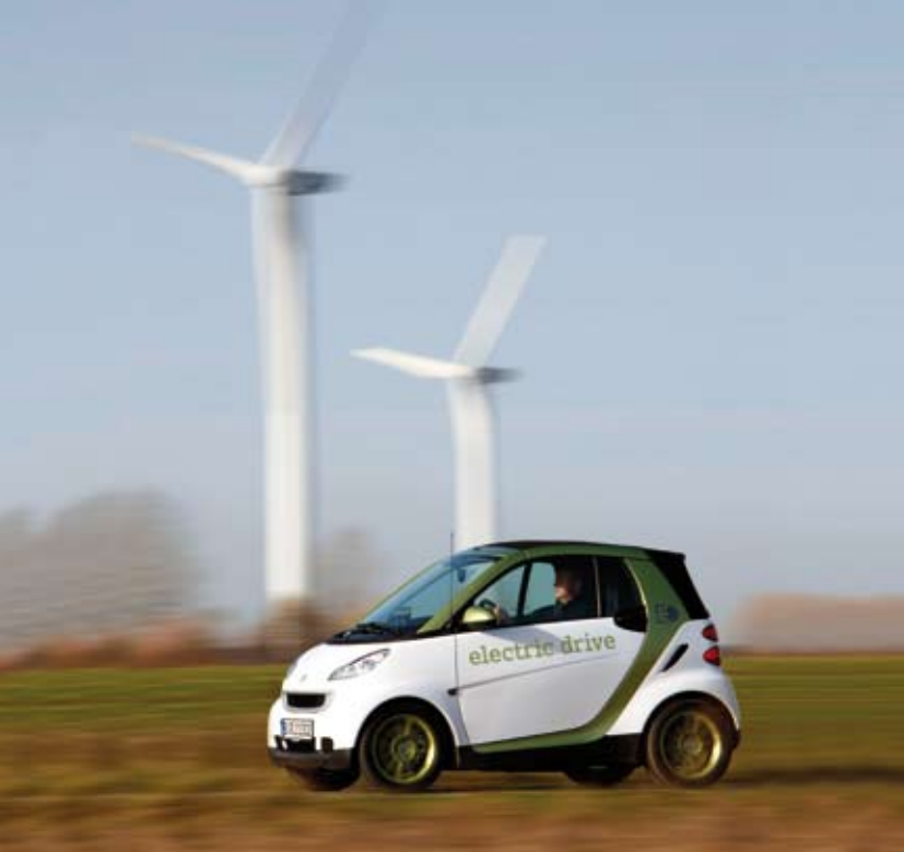
smart fortwo electric drive, Daimler AG