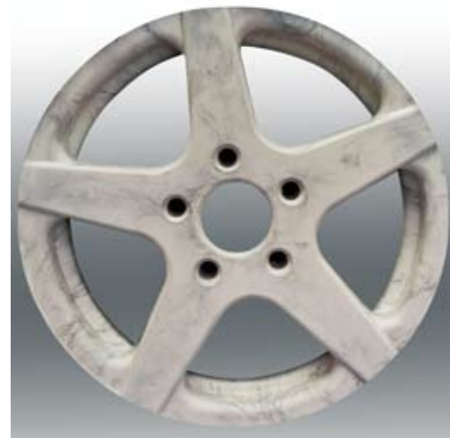
Leichtbau Rad aus faserverstärktem Kunststoff, Fraunhofer-Institut für Chemische Technologie ICT