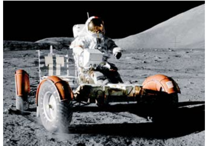
Apollo 17-Mission am 11.12.1972