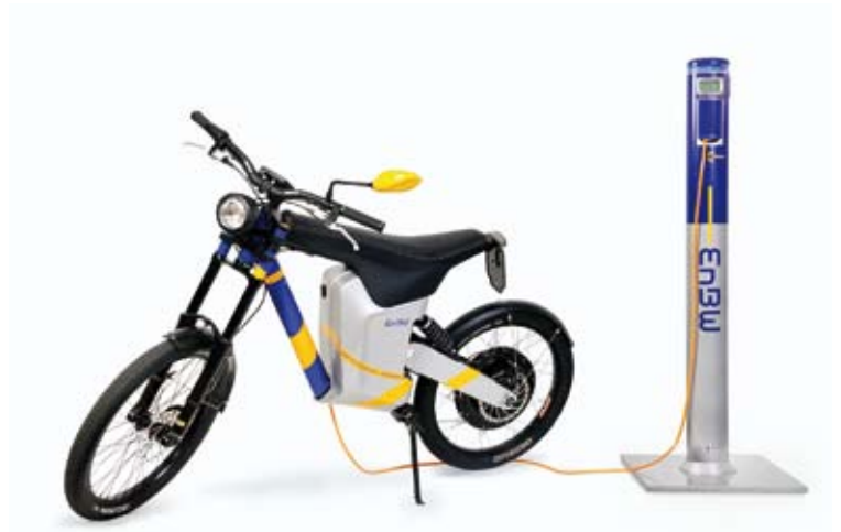
ELMOTO, EnBW AG