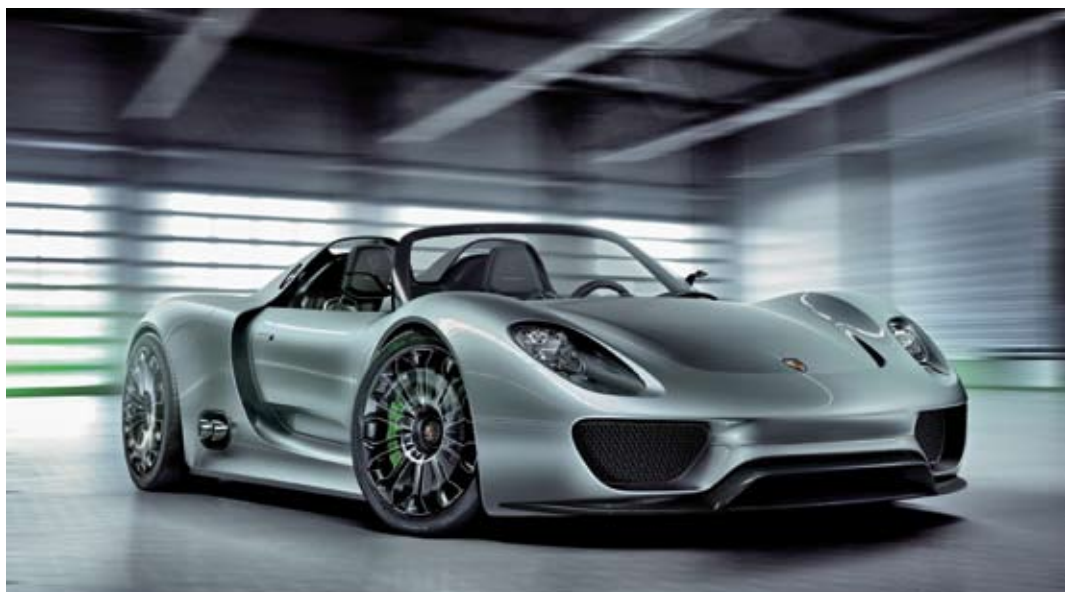
Porsche 918 Spyder Plug-In-Hybrid, Dr. Ing.h.c. F. Porsche AG

Zu den Projektpartnern gehören Global Player, mittelständische Firmen und Unternehmensgründer. Zahlreiche Organisationen, Hochschulinstitute und Forschungseinrichtungen unterstützen das Konzept, ebenso wie Städte und Gemeinden. Die folgenden Listen sind Momentaufnahmen, die kontinuierlich fortgeschrieben werden.