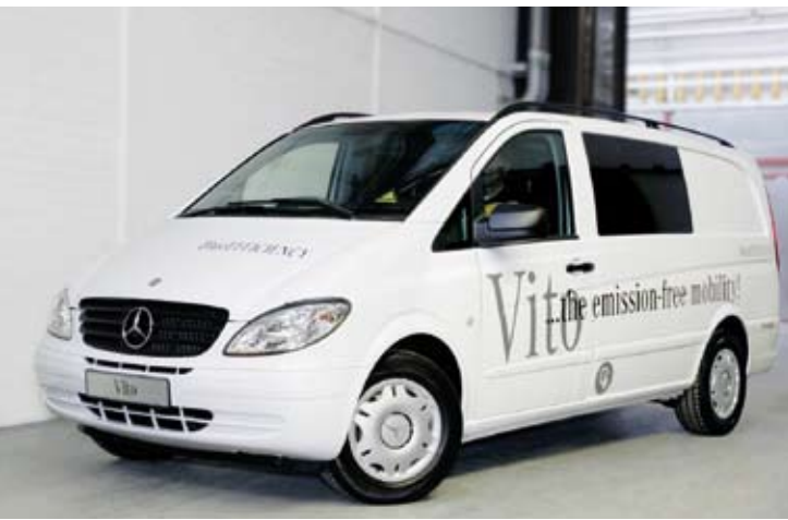
Vito E-CELL, Daimler AG